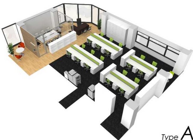
Type A 座席数:21席